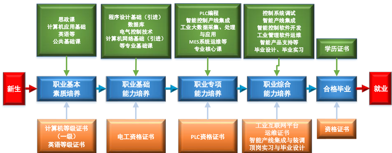
图 2 课程体系与职业能力之间的匹配关系

课程体系的设置服务于专业能力结构的要求，整个课程体系划分为公共课、专业基础课、专业核心课、专业拓展课、毕业实践等五大模块，为学生逐步构建职业基本素质、职业基础能力、职业专项能力和职业综合能力，以适应职业面向与岗位需求。