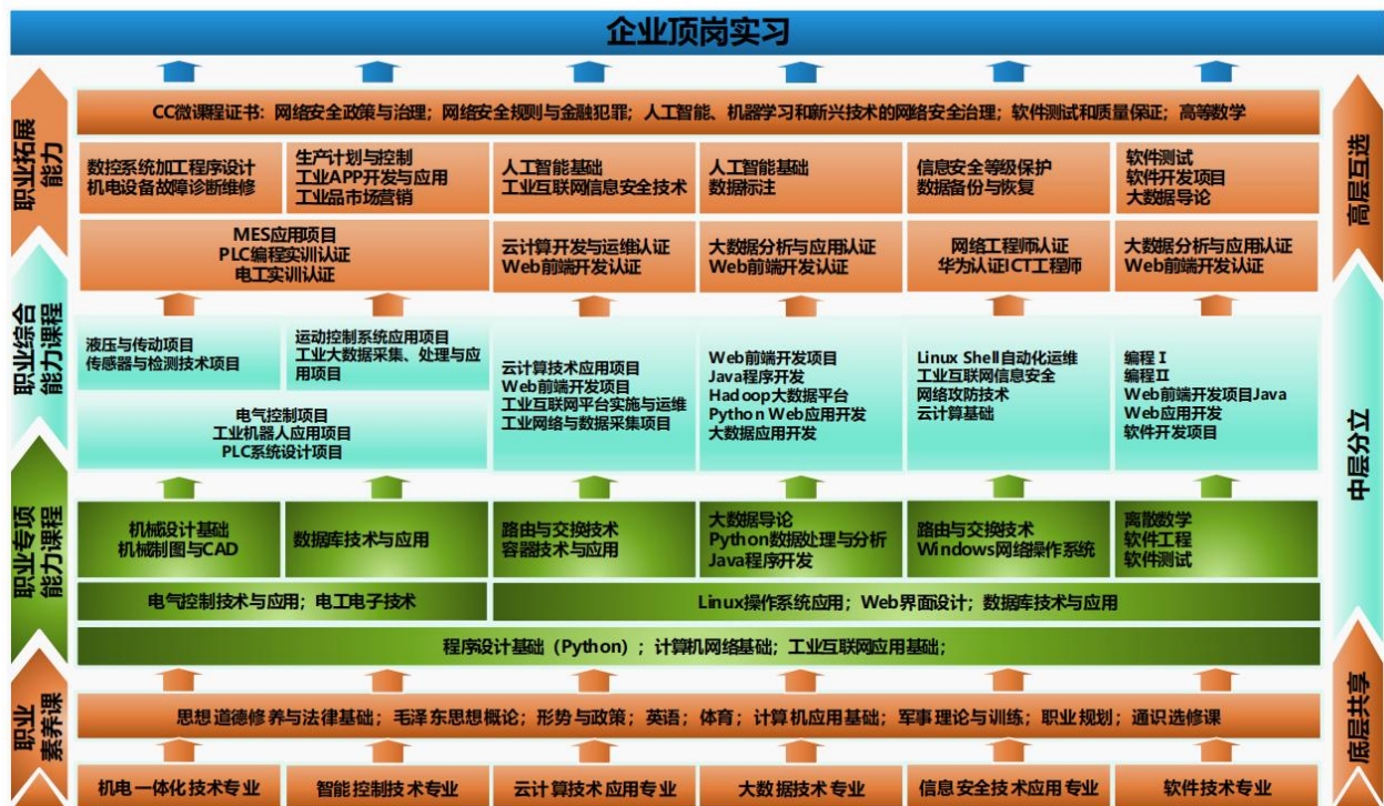
图 3 项目引领、任务驱动“231”课程体系